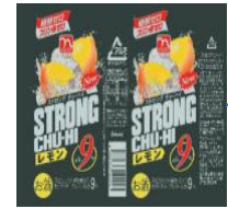
良品マスターデータ